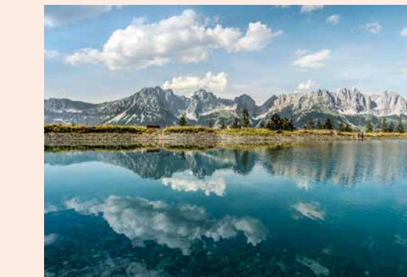
Himmel, Fels und Wasser, das perfekte Fotomotiv: die schöne Südseite des Wilden Kaisers, gesehen vom Astbergsee bei Going.

zu kaiserlichen Köstlichkeiten (Bild links unten). Geöffnet bis Mitte Oktober. Gaudeamushütte Am Kaiser 190, 6353 Going Tel.: +43/5358/22 62